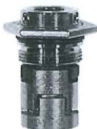
Kit, Shaft seal GROUND FOS TYPE CR(I) 10/15/20