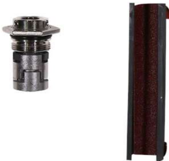
Kit, Shaft seal GROUND FOS TYPE CR(I) 10/15/20