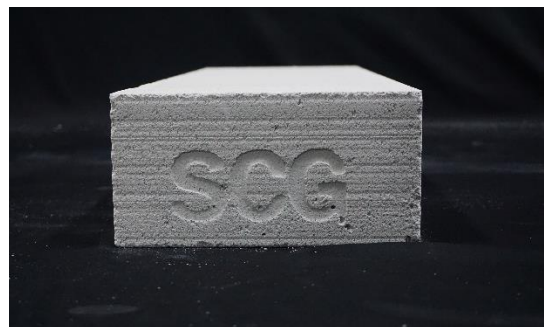
2. Foto contoh uji tampak samping